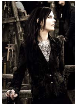
Anette Olzon (Nightwish) :