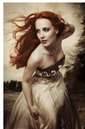
Simone Simons (Epica) :