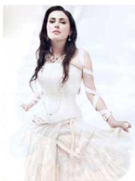
Sharon Den Adel (Within' Temptation)