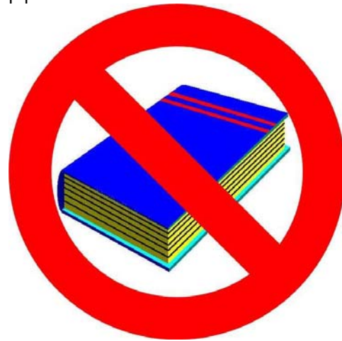
Μαρία-Ειρήνη Μαυτομάτη Γ3 Μαριάντζελα Μιχελάκη Γ3

Φέτος λοιπόν θεωρούμε ότι θα πρέπει να διαφυλάξουμε τα βιβλία μας σε καλή κατάσταση, ώστε να τα πάρουν τα παιδιά της επόμενης τάξης. Είναι θέμα οικονομίας και οικολογικής συνείδησης, αλλά πρωτίστως πολιτισμού ο σεβασμός στο σχολικό βιβλίο.