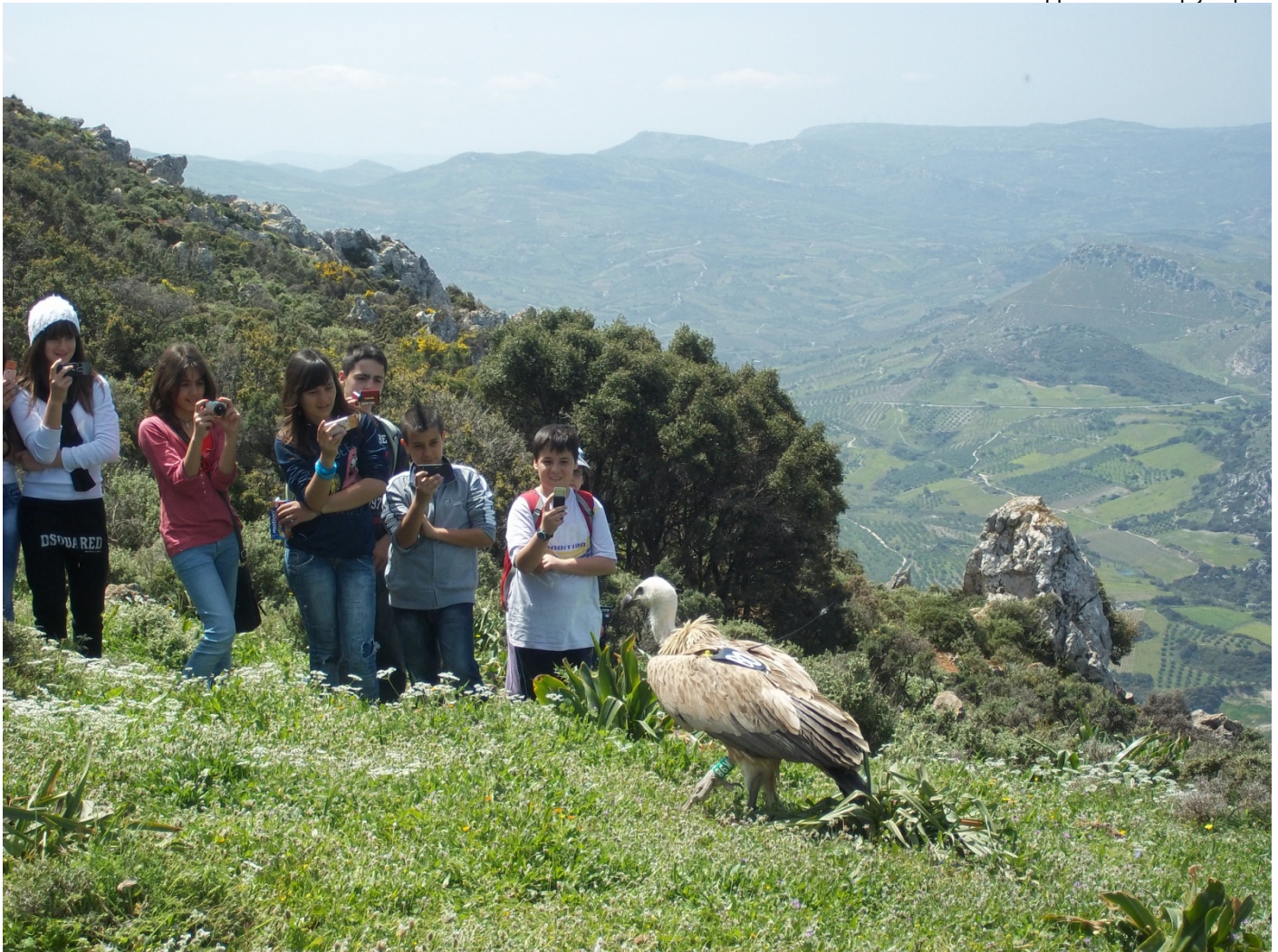
Τα παιδιά της περιβαλλοντικής ομάδας και της εφημερίδας αποθανατίζουν τον ένα γύπα λίγο πριν πετάξει ελεύθερος και θεραπευμένος πια στον ουρανό του Γιούχτα.