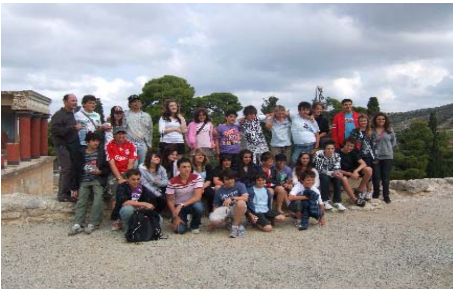
Από την επίσκεψή μας στην Κνωσό συνοδεύοντας τη θεατρική ομάδα του ελληνόφωνου σχολείου Alphington